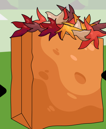
Los Desechos de Jardín